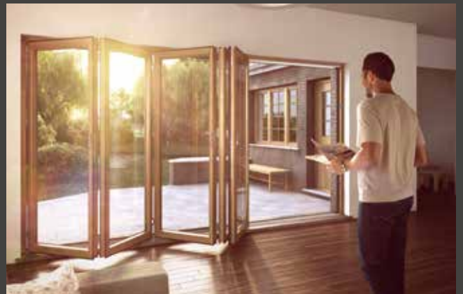
Holz-Faltwand Timber Folding Door