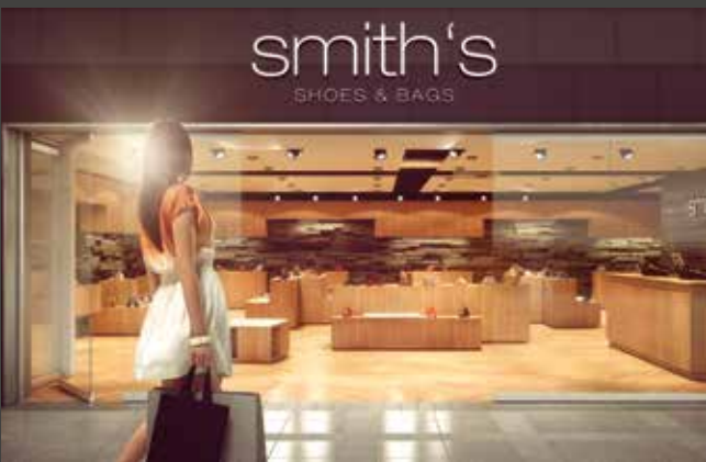
Horizontal-Schiebe-Wand-Systeme Horizontal Sliding Wall Systems